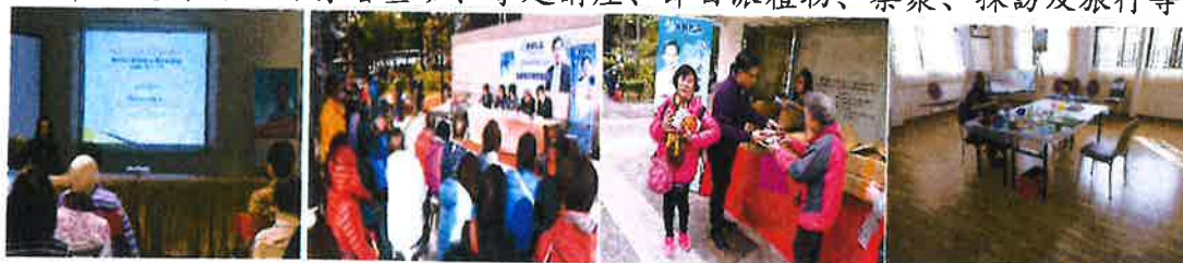
2017 年 12 月 12 日 愉景灣婦女養生講座

除了義務法律諮詢以外，匯蝶公益亦在發展其他非牟利的社區服務項目，最近進行的活動有繪畫班、專題講座、節日派禮物、茶聚、探訪及旅行等。